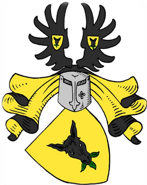
Familie Riedesel Freiherren zu Eisenbach