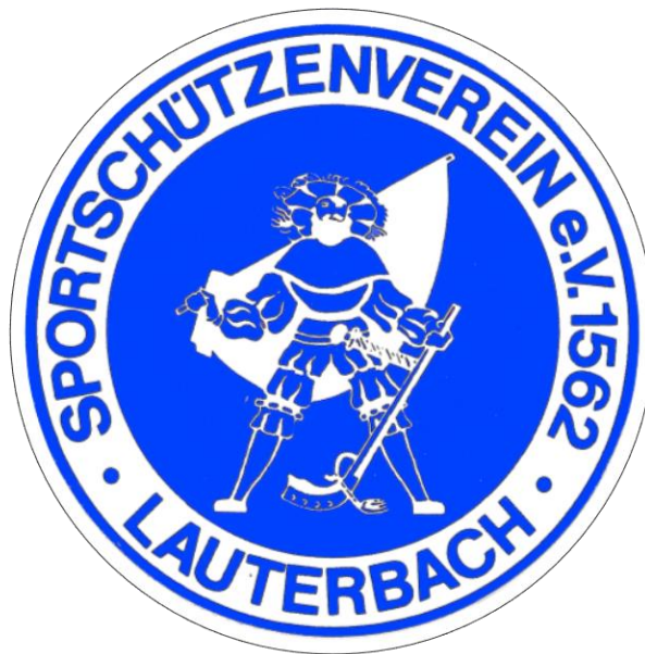
Sportschützenverein Lauterbach 1562 e.V.

Allen Bogenschützen vom SSV-Lauterbach aus den vergangenen Jahren bis heute